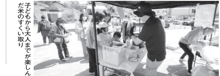
子どもから大人までが楽しんで米のすくい取り