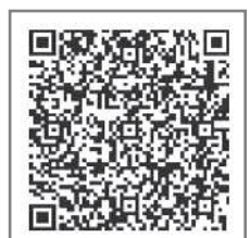
CAMPFIREのページのQRコード