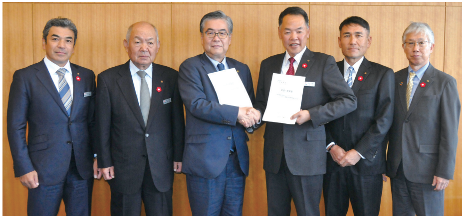
令和7年10月27日、小諸市への要望提言提出において

中小企業、小規模事業者の現状把握を行い、委員会・部会などから集められた要望提言を取りまとめ、下記の内容で小諸市長宛てに提出をしました。