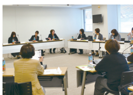
女性市議との意見交換会

◆ 女性会 当所会員である企業の女性役員や個人企業の経営に携わる女性の皆さんにより組織されています。経営に関する講演会やセミナーのほか、地域への貢献として高齢者福祉施設へタオルの寄贈を行う事業などを実施しています。