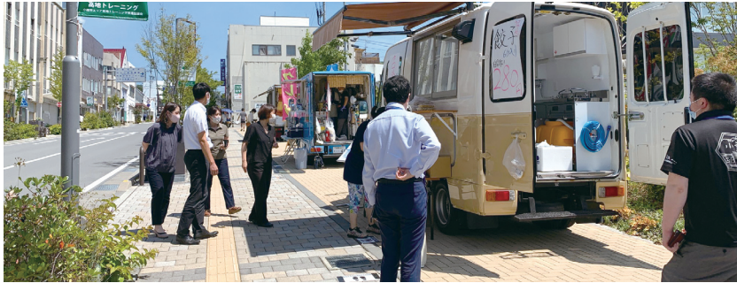
◆KOMORO FOOD STAGE 商業委員会

当所は「商業」「工業」「観光」「経済環境」「建設」「総務企画」の6つの常任委員会と、その時々課題に対して取り組む特別委員会を組織しています。産業別、課題別に各委員が議論、研究、実践を行いながら、小諸の産業振興の可能性を探っています。