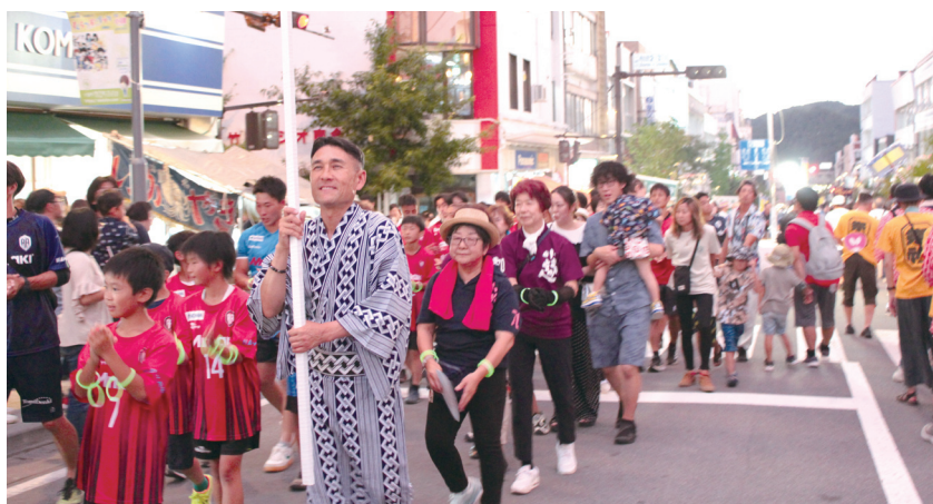
「ドカンショ」には、小諸商工会議所連として参加しました