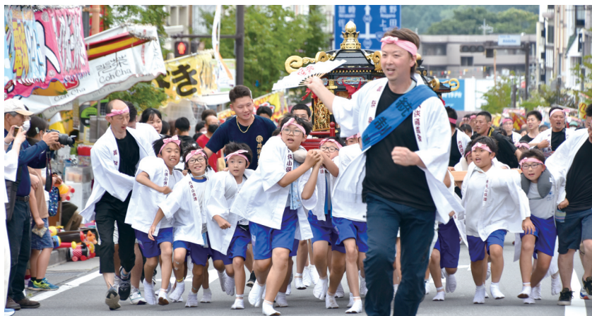
市民まつり「みこし」

50年以上続くこもろ市民まつり。小諸の夏の幕開けとして毎年多くの市民の皆様が楽しみにされている本イベント。